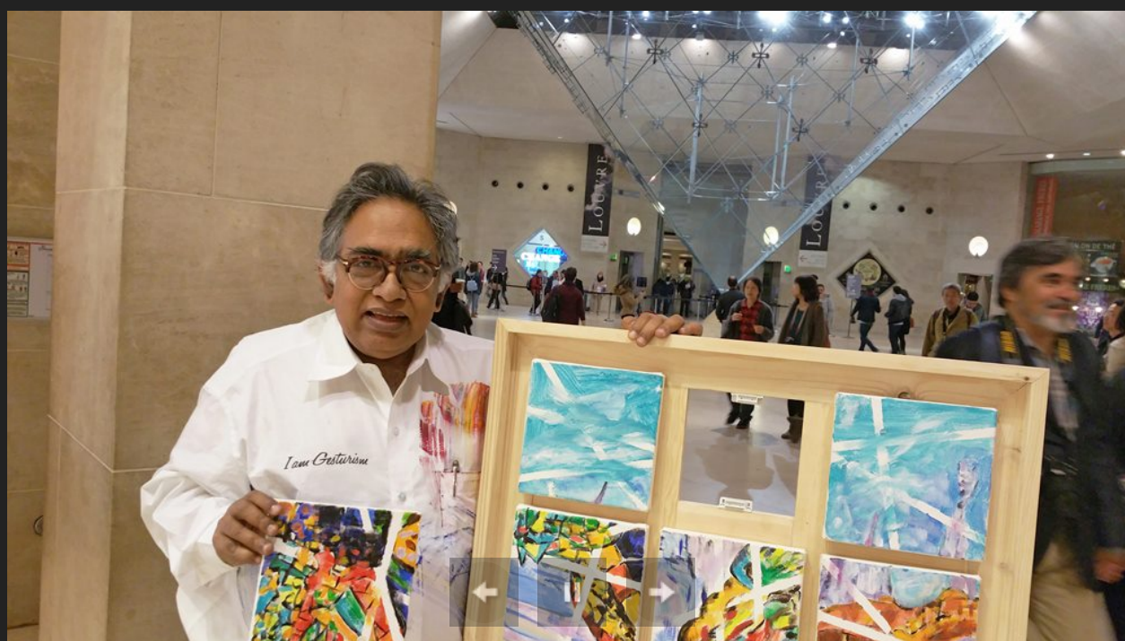
Sen al Museum Louvre