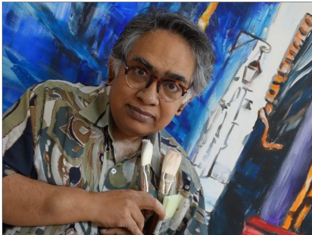
Sen Shombit Sengupta

Dal 14 Novembre 2015 al 21 Novembre 2015